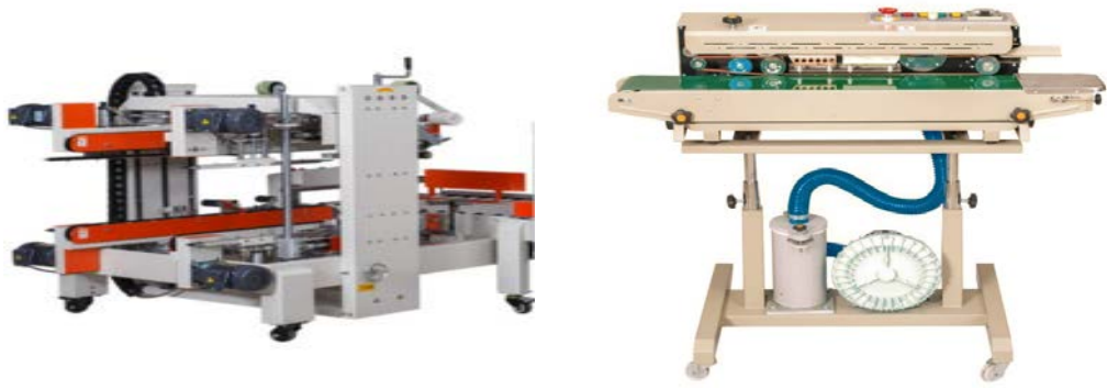
图 2 封箱机、封口机