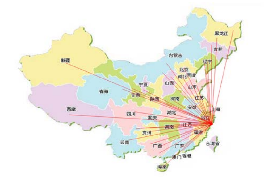
图 3 国内销售网络分布图

式铺路，期间也经历过喜与悲，伤和痛，尤其是机械行业根本就没有参照的模式，经过 2019 年销售额达到人民币 13717 万元，确保了这几年每年 20%以上的销售额增长。