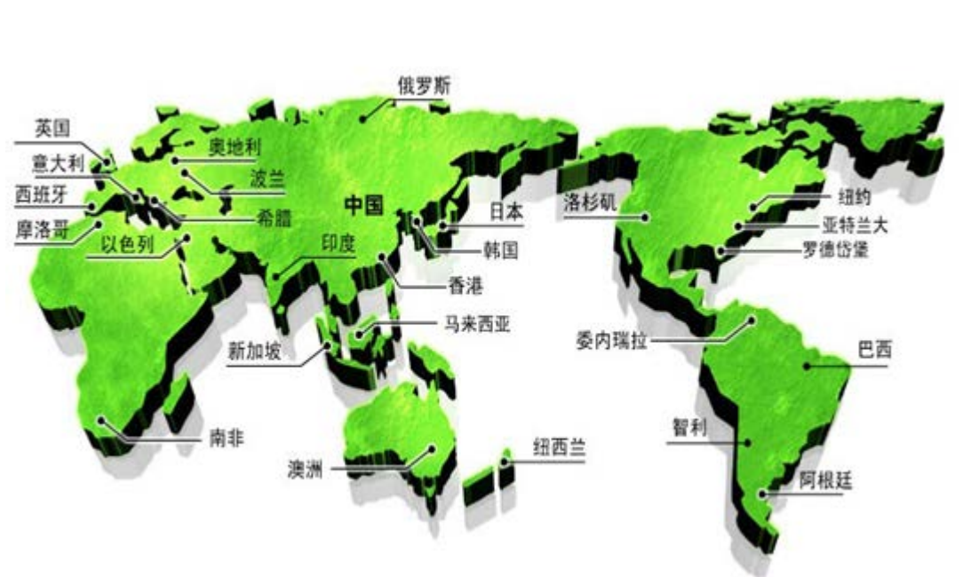
图 4 公司顾客遍布全球